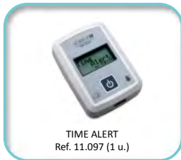
TIME ALERT Ref. 11.097 (1 u.)