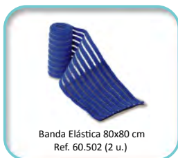
Banda Elástica 80x80 cm Ref. 60.502 (2 u.)