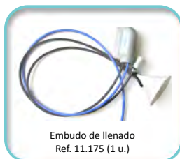
Embudo de llenado Ref. 11.175 (1 u.)