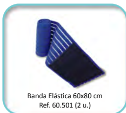
Banda Elástica 60x80 cm Ref. 60.501 (2 u.)