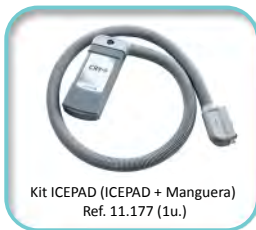
Kit ICEPAD (ICEPAD + Manguera) Ref. 11.177 (1u.)