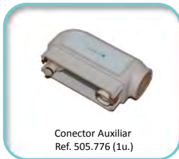
Conector Auxiliar Ref. 505.776 (1u.)