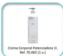
Crema Corporal Potenciadora 1l. Ref. 70.065 (1 u.)