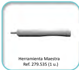
Herramienta Maestra Ref. 279.535 (1 u.)