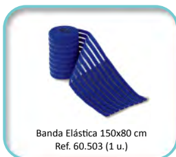
Banda Elástica 150x80 cm Ref. 60.503 (1 u.)