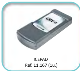
ICEPAD Ref. 11.167 (1u.)