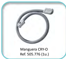
Manguera CRY-O Ref. 505.776 (1u.)