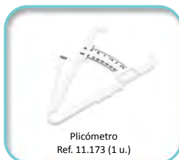
Plicómetro Ref. 11.173 (1 u.)