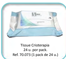
Tissue Crioterapia 24 u. por pack. Ref. 70.073 (1 pack de 24 u.)