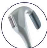
Cabezal Módulo NIR